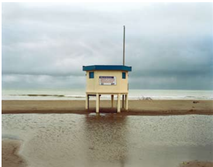
Narbonne Plage, Aude. Décembre 2005

Photographies / films Mars 2009 - Janvier 2010 Alès, Perpignan, Montpellier