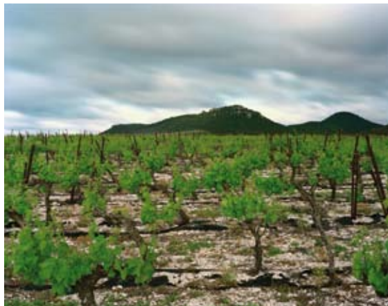
Arboras, Hérault. Mai 2007