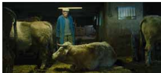
La vie moderne, Raymond Depardon / Magnum Photos