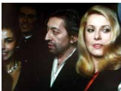
Reporters, Raymond Depardon / Magnum Photo

En 2006, il est directeur artistique invité des Rencontres d'Arles. Il réalise en 2008 son dernier opus sur le monde paysan, La vie moderne .