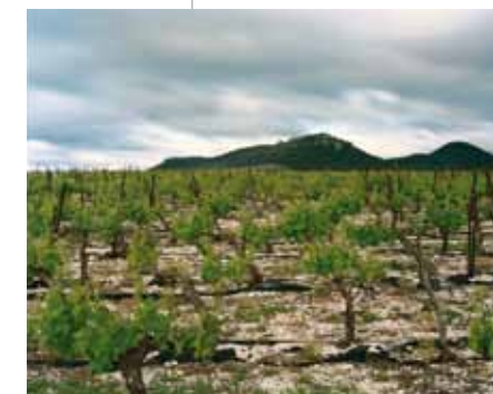
Série Un regard sur le Languedoc-Roussillon Collection du Conseil Régional Languedoc-Roussillon

Depuis 2006, Raymond Depardon fait des escales régulières en Languedoc-Roussillon. Plus qu'un travail abouti, achevé, il présente ici son regard, à une période, sur un territoire spécifique, marquant ainsi une étape dans son travail en cours.