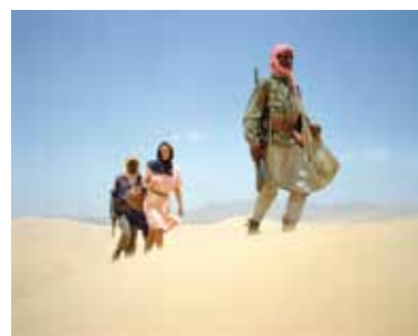
La captive du désert, Raymond Depardon / Magnum Photos

Raymond Depardon en Languedoc-Roussillon Montpellier 6 novembre 2009 - 31 janvier 2010 Photographies Films Conférences Rencontres