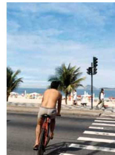
Rio de Janeiro, 2004 - Série Villes Exposition produite par la Bibliothèque Municipale de Lyon